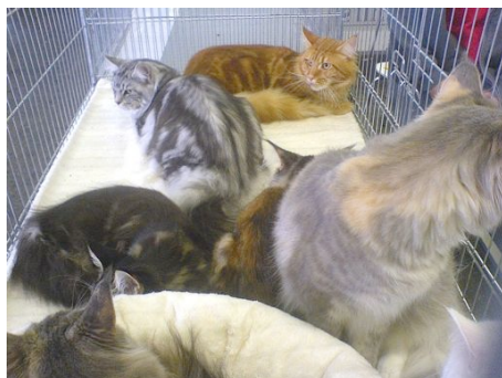
Keine Angst: jede Katze hatte an der Ausstellung ihren eigenen Käfig! Diese Maine Coon Familie wartet am Sonntag abend auf die Heimreise.