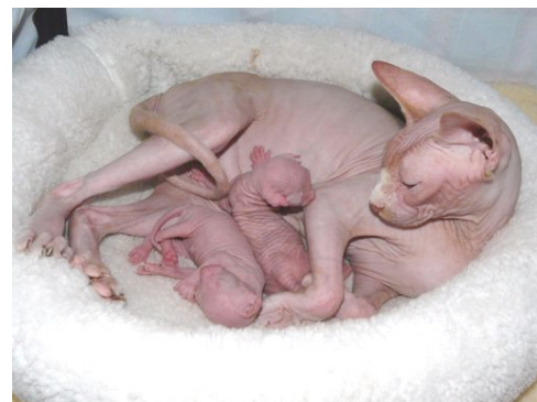
GIC Alnakeed Katie Delight mit Elfin Delight's Shakira und Elfin Delight's Samir, 01.08.09.

Zum Glück gibt es aber auch viele Leute, die von den Sphynx nicht nur begeistert sind, sondern sie sie geradezu fantastisch finden! In Italien, Frankreich, Deutschland sowie in der Romandie und im Tessin sind sie sehr beliebt. Ich habe schon mehr als ein Mal von einem Besucher gehört, dass es sein grosser Traum sei, mal eine eigene Sphynx zu besitzen. Ich möchte gerne Sphynx züchten, und eine meiner Katzen, Katie, hat mir im Sommer 2009 zwei wunderschöne Babys geschenkt. Ich hoffe, in Zukunft, mehr Würfe zu erleben, zumal Katie eine super Mama ist—und die Babys sind eine wahre Freude!