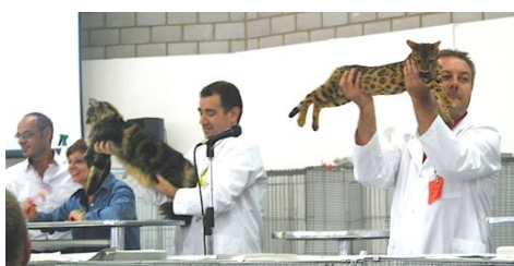
Samstagnachmittag: Best in Show