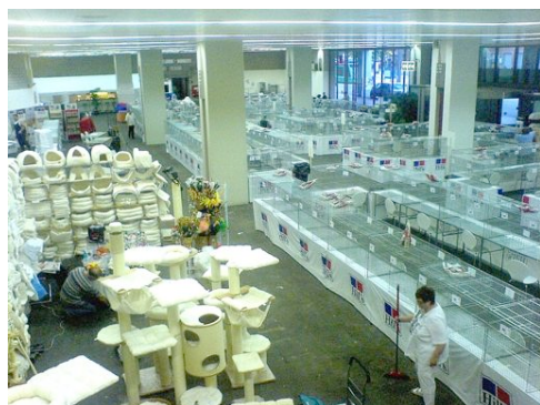
Aufbau am Freitag abend. Vielen Dank den Helfern !