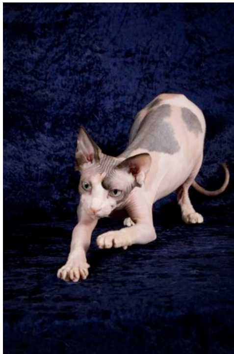
SC Alnakeed Kalli Delight, Ausstellung in Bülach, 27.01.07.

absurdeste Bemerkung war die: „Du Fritzli, schau mal! Da sind die Katzen, die ohne Haut gezüchtet werden!“