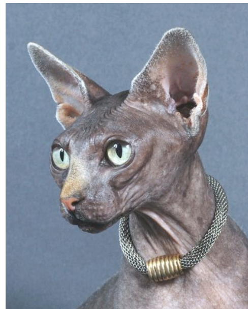
Supreme Champion Hazel-Mary Moon mes bijoux, Ausstellung Neuchâtel, 19.10.08

hen, wie freundlich und lieb die Katzen sind. Und wenn sie sie streicheln oder gar im Arm halten, können sie feststellen, wie weich und angenehm sie sind. Viele haben mir gesagt, dass die Sphynx in Photos nicht sehr sympathisch wirken, dass sie aber in Natura wunderschöne Tiere seien.