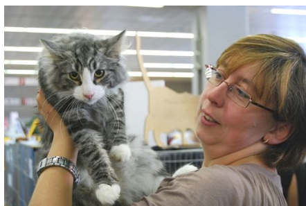
Die Hauptdarsteller: Katzen und Aussteller