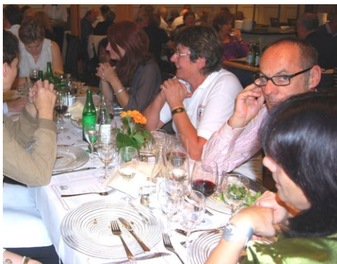
Samstagabend: Galadinner mit den Richtern und dem Organisationskomitee