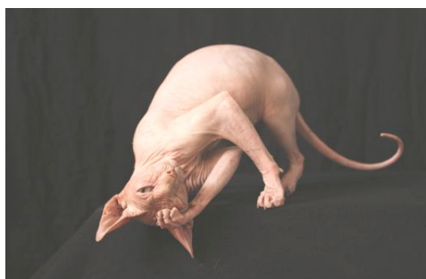
GIC Alnakeed Katie Delight, Animalia Lausanne 19.10.09.

Dann gibt es viele Besucher, die ganz einfach Mitleid haben mit den „armen Kreaturen, die sicher kalt haben müssen.“ Die Sphynx hat aber einen anderen Stoffwechsel als Katzen mit Fell, und deshalb hat sie auch nicht kalt. Sie fühlt sich schön warm an. Meine gehen auch in Winter manchmal in den Garten, um den Schnee anzuschauen, kommen aber bald wieder herein. Ich übrigens auch! Starke Sonnenbestrahlung direkt auf die Haut, besonders einer hellhäutigen Sphynx, kann natürlich schädlich sein.