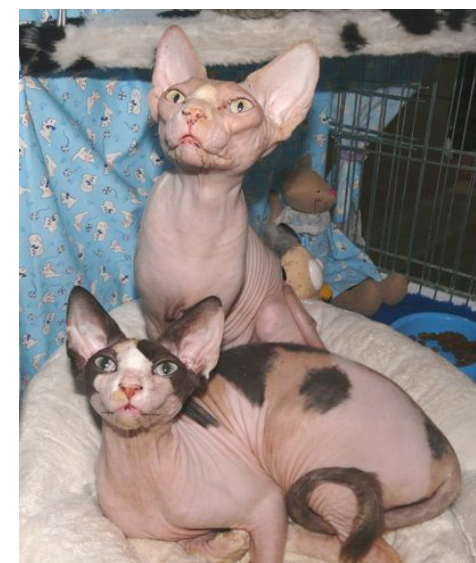
Supreme Champion Alnakeed Katie Delight und Grand International Champion Alnakeed Kalli Delight, Ausstellung in St.Gallen, 17.5.09.

Meine erste Sphynx habe ich im Jahr 2001 erhalten. 2003 habe ich dann angefangen, meine nackten Katzen in FIFé-Ausstellungen auszustellen. Da ich so viel Freude an meinen Katzen habe, wollte ich gerne diese Rasse dem Schweizer Publikum näher bringen. Welch eine Achterbahn von Gefühlen habe ich seit der ersten Ausstellung erlebt! Es ist unglaublich, wie beleidigend Ausstellungsbesucher sein können. Manchmal war ich empört, manchmal richtig zornig (obwohl ich meistens ruhig blieb und mich beherrschen konnte), und oft musste ich einfach darüber lachen! Die lustigste und zugleich