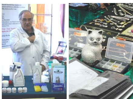
Wichtig: Verkaufsstände mit Katzenszubehör