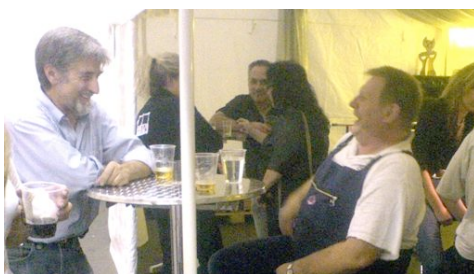
Wohlverdienter Umtrunk in Robertos Bar nach dem Abbau